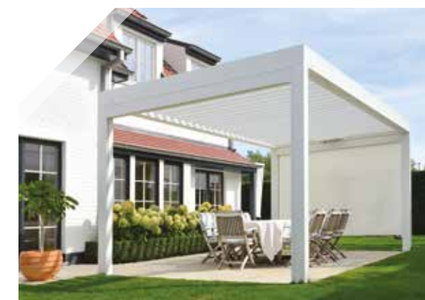
Optionale Aufbauscreens schützen zuverlässig vor Wind.